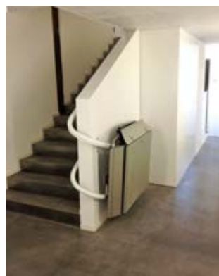
Der Durchgang ist komplett frei bei geschlossener Plattform