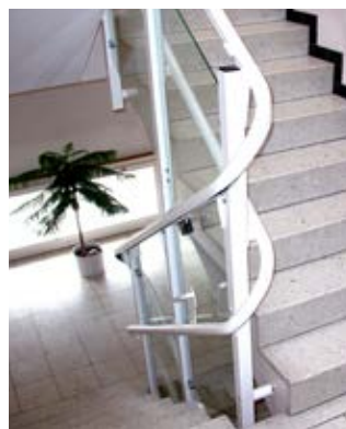
Oberes Fahrbahnrohr kann gleichzeitig als Handlauf benutzt werden