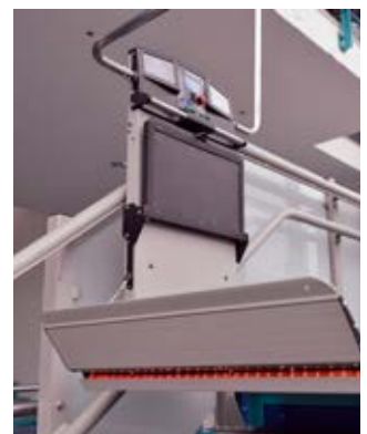
Sicherheitssensoren schützen andere Treppennutzer