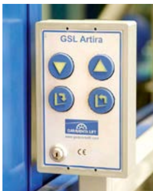
Genial einfache Bedienung, dank Smart-Lite Technik