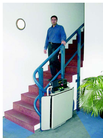
Zusammengeklappt ist die Plattform auf engstem Raum versorgt

GARAVENTA LIFTECH AG präsentiert sich an der Zofinger Gewerbeausstellung, ZOGA'03, vom 6. bis 9. November 2003. Für Sie vielleicht eine gute Möglichkeit unsere Produktpalette zu besichtigen. Nach Voranmeldung sind aber auch jederzeit Besichtigungen bei uns im Werk in Küssnacht möglich.