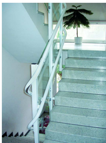
Die Fahrschienen ergeben ein normal verwendbares Geländer

Gleichzeitig mit der Einführung des neuen Produktes erfolgte auf allen Ebenen die dazu notwendige Ausbildung. Verkauf, Fabrikation, Montage- und Servicepersonal wurden am neuen Produkt intensiv geschult und garantieren durch hohe Professionalität die Voraussetzung für zufriedene Kunden.