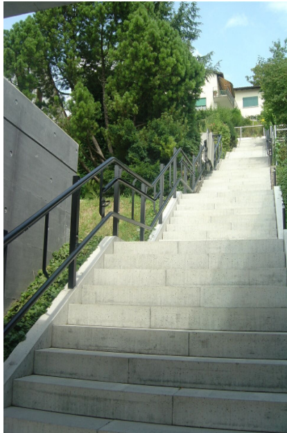
Beispiel einer Erschliessung

Im bekannten Bündner Kurort Vals entstehen zur Zeit an Hanglage zwei Mehrfamilienhäuser. Die insgesamt 11 Wohnungen werden im Stockwerkeigentum verkauft. Schon bald stellte die Bauherrschaft fest, dass viele der Interessenten (meist mittleren Alters) bedenken haben, die Treppen mit zunehmendem Alter noch gehen zu können.